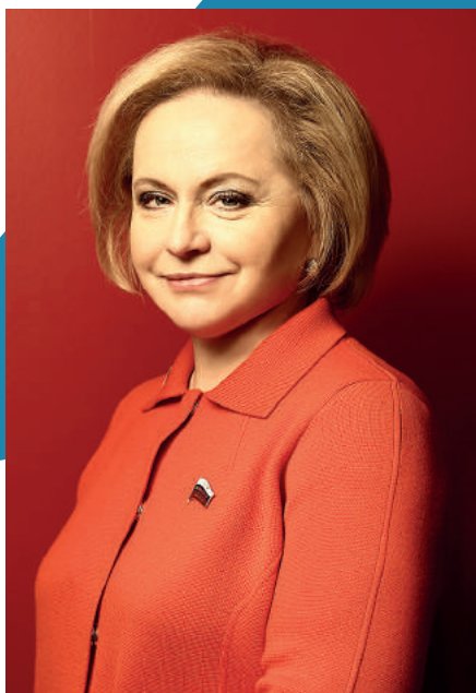
Любовь Николаевна Духанина, заместитель председателя Комитета по образованию и науке ГД РФ, член Центрального штаба ОНФ, координатор проекта «Равные возможности – детям»